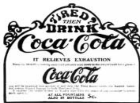
A Coca-Cola megjelenésének évében még valóban tartalmazott kokaint is.