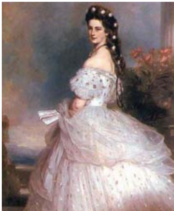
Erzsébet császárné Franz Xaver Winterhalter festményén

nak. A kisebb-dőlő a szűkebb családi körben eltöltött ételek színhelye. A faburkolatos falat csendeltek és Mária Teréziát családja körében ábrázoló festmény díszíti. A tálalóban található porcelánok és üvegedények a királyi család részére készültek, Ferenc József monogramja