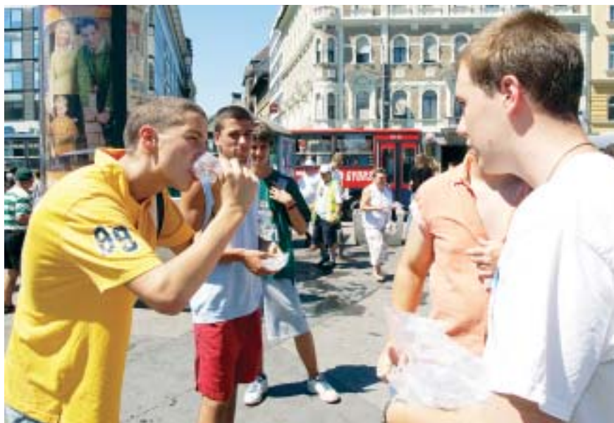
A 40 fokos kánikulában életet menthet egy „zacskó” hideg víz is