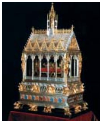
Augusztus 20-án a Szent István-napi körmeneten első királyunk Szent Jobbját kísérik a hívek a Bazilika körül

A keménykezű, szigorú uralkodó nyugati értelemben vett államot szervezi a Kárpát medencében. Maga is jó példát mutatva, a kereszténység elterjedését és megszilárdítását tűzi ki célul. Bertartja az egyház törvényeit, megalapítja az érsekségeket és a püspökségeket, elrendeli, hogy minden tízedik falu építsen templomot. Megszervezi a vármegyéket, rendezi az udvartartást. Védi a földbirtokot és a magántulajdont, megteremti a pénzrendszert. A felkelések leverésével biztosítja hatalmát az ország egész területén, és sikeresen védekezik a külső támadások ellen is. Világi hatalmát megkoronázásával még szilárdabbá teszi. Az ország kormányzását, a törvény-