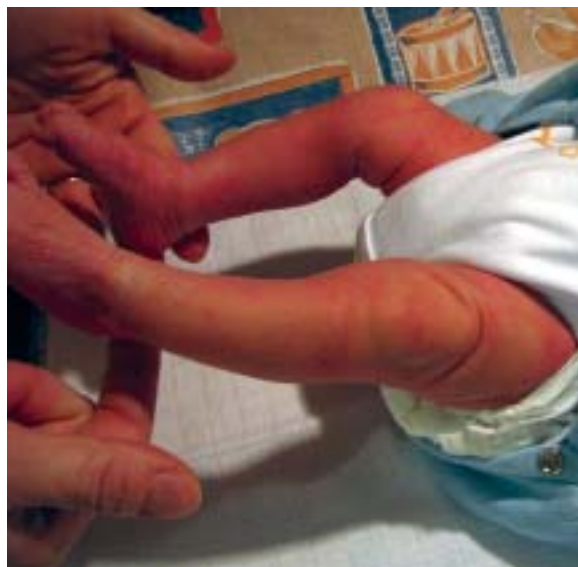
A masszázis segíti a kicsik jobb fejlődését és a környezethez fűződő szorosabb kapcsolat kialakítását

A szerző a gyakorlatban alkalmazza, sőt oktatja is a thai masszázst. Az érdeklődő szülők számára elméleti képzést is tart, ahol az anyukák és az apukák megtanulhatják a masszírozás energetikai hátterét, egyéni foglalkozások keretében pedig el sajátíthatják a masszírozási technikákat.