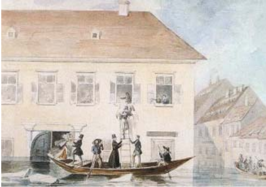
Mentési jelenet a pesti árvíz idején, 1838 - vízfestmény

A Dohány utca kezdetől fogva jelentős közlekedési útvonal volt. Gyakran vették erre útjukat a Hatvani kaputól az ország keleti részébe tartó és onnan érkező fogatok. Ezért is települt ide több szálló és vendéglő. Ilyen nevezetes szálló volt a Dohány utca elején álló Arany Szitához nevű ház, ahol Déryné Széppataki Róza az 1838-as árvíz idején lakott. A felejthetetlen Déryné naplójában megörökítette az 1838-as pesti árvizet. A vándorszínész korának legnépszerűbb színésznője az 1837-ben megnyílt Pesti Magyar Színházban is játszott. Éppen duettet énekelte Déryné Schodelnével, amikor a közönség sorában mozgás támadt. Ő azt hitte, talán tűz ütött ki. „Nem - felelének: -víz!” Az előadást még befejezték, majd kirohantak a színházból. Hazaérve szólt a lánynak, siessen a Mátyás fogadóba, hozzon kenyeret is a vacsorához, mert elfogyott. A lány