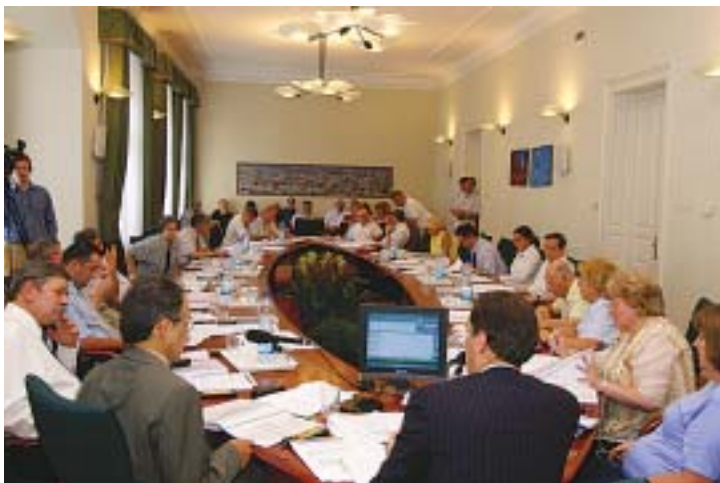
A testület egyhangúlag fogadta el a javaslatot