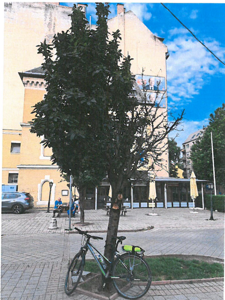
a vizsgált fa fotója

A fa kertészeti módszerekkel nem ápolható, kivágását és pótlását várostűző fa fajjal javaslom az ingatlan területén elvégezni.