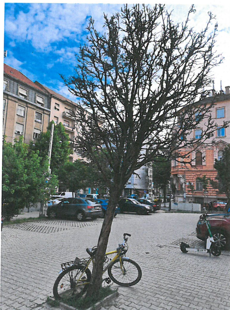
a vizsgált fa fotója

A fa kertészeti módszerekkel nem ápolható, kivágását és pótlását várostűrő fa fajjal javaslom az ingatlan területén elvégezni.