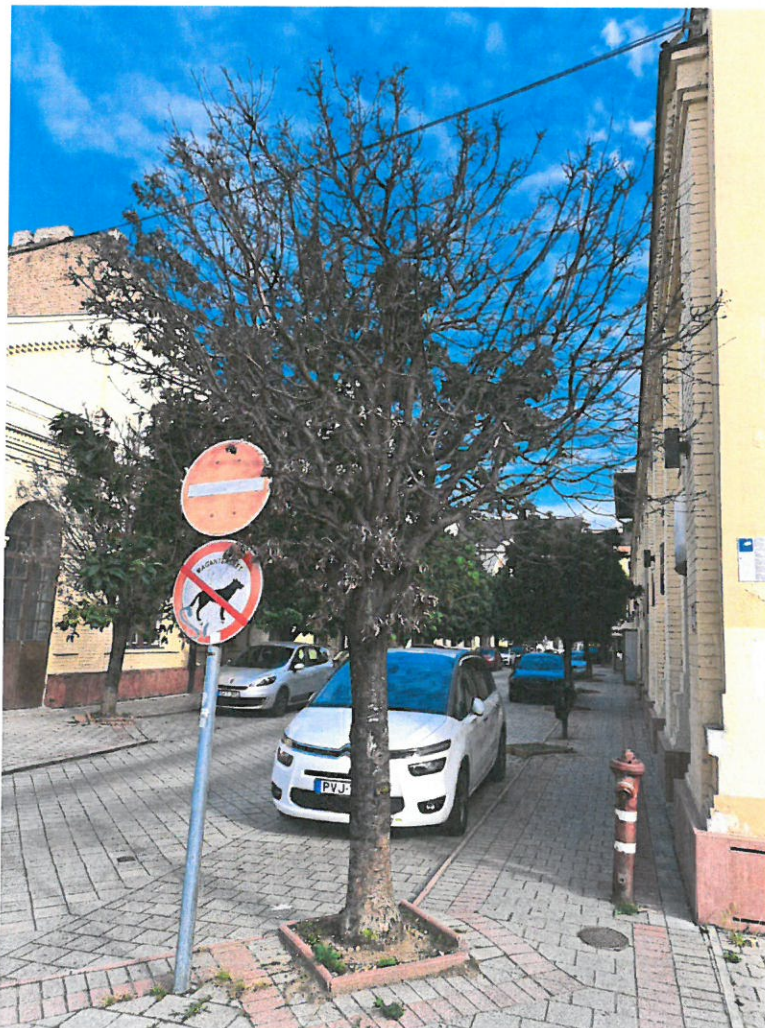
a vizsgált fa fotója

A fa kertészeti módszerekkel nem ápolható, kivágását és pótlását várostűrő fa fajjal javaslom az ingatlan területén elvégezni.