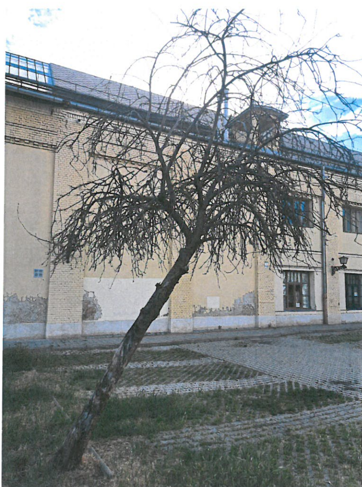
a vizsgált fa fotója

A fa kertészeti módszerekkel nem ápolható, kivágását és pótlását várostűrő fa fajjal javaslom az ingatlan területén elvégezni.