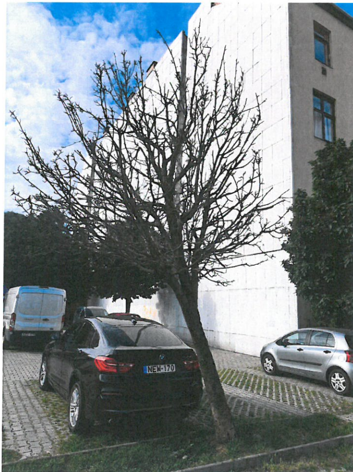
a vizsgált fa fotója

A fa kertészeti módszerekkel nem ápolható, kivágását és pótlását várostűrő fa fajjal javaslom az ingatlan területén elvégezni.