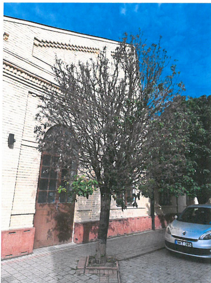
a vizsgált fa fotója

A fa kertészeti módszerekkel nem ápolható, kivágását és pótlását várostűrő fa fajjal javaslom az ingatlan területén elvégezni.