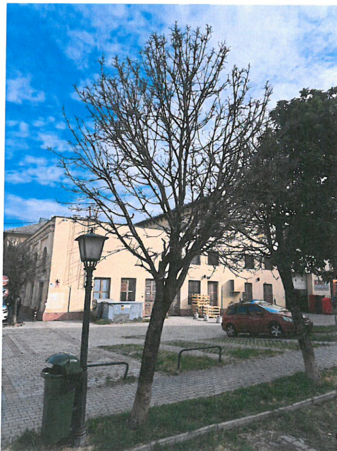
a vizsgált fa fotója

A fa kertészeti módszerekkel nem ápolható, kivágását és pótlását várostűrő fa fajjal javaslom az ingatlan területén elvégezni.