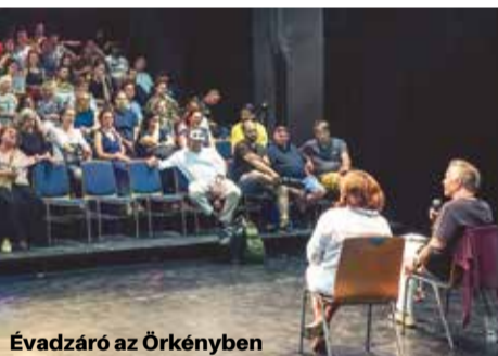
Évadzáró az Örkényben