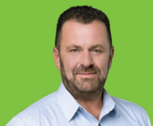
DEVOSA GÁBOR a 9. választókerület képviselője