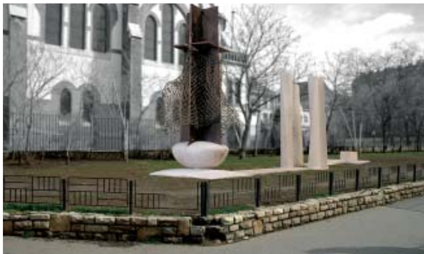
A hármasszoborcsoport a születést és feltámadást, az életet és a halált jelképezi

A szépen kiépített parkrészek, a gondosan őrzött játszóterek, az ápolt és ellenőrzött növényzet mind a kerületi lakók közérzetének javítását szolgálják, és nem utolsósorban turisztikailag is emelik a VII. kerület színvonalát. A következő testületi ülésen kerül a képviselők elé a javaslat, mely szerint a Bajza utcánál lévő zöldterületen három részből álló szakrális