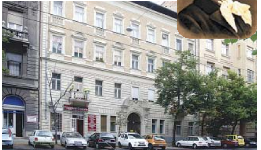
Bródy a Damjanich utca 34-ben lakik amikor A tanítónő-t írja

szébb emléke az 1900-ban megjelent tizenkét kötet Fehér könyv”. A szabad, bátor hangú írásaira azonban nem kap biztatást, abbahagyja ezt a küzdelmes munkát. Visszatér megszokott életéhez. 1902-ben megírja legjobb regényét, A nap lovagját és A dada című színdarabját, 1903-ban megindítja a Jövendő című hetilapot, a Nyugat elődjét. A túlfeszített munka és az anyagi gondok egésze rováására mennek, idegszanatóriumba kerül. Semmering mellett, a szanatórium kertjében vég-