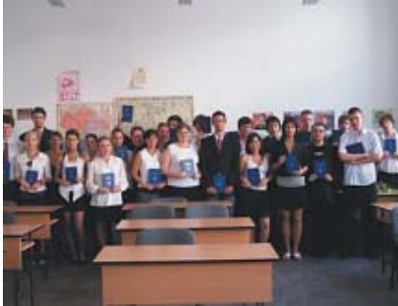
Az iskola 2007-ben érettségizett diákjai

A Facultas Cognoscendi Akadémia Alapítvány által működtetett iskolahálózat gimnáziuma nappali tagozatra főként a humán érdeklődésű diákok jelentkezését várja, akik jogász, bölcsész, illetve államigazgatási pályára készülnek, illetve a humánszférában szeretnének elhelyezkedni. Szakközépiskolájában nappali tagozaton érettségire épülő, több szakmai végzettség megszerzésére nyílik lehetőség,