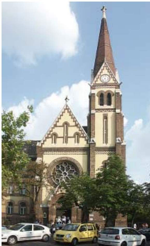
A Városligeti Fásorban található a Pec Samu tervei alapján 1905-ben épült Fásori Evangélikus Templom