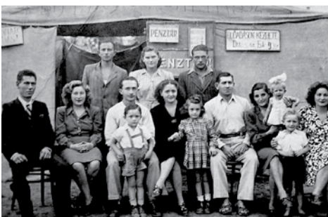
Ötvös cirkusz, 1947

úr fegyveres kísérettel, és mindenüket elvették. Arra kényszerítették őket, hogy a cirkusz minden rekvizitumát hozzák fel Budapestre, a cirkusz Hungária körüli telephelyére. Egyetlen apró lakókocsit és egy lovat hagytak meg nekünk. Munkát persze nem adtak, így Papának el kellett mennie fuvarozni, hogy valamiből élni tudjunk, ez télen különösen nehéz volt.