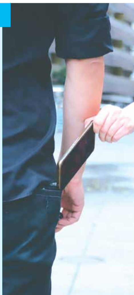
Összeállította: Sándor Zsuzsa