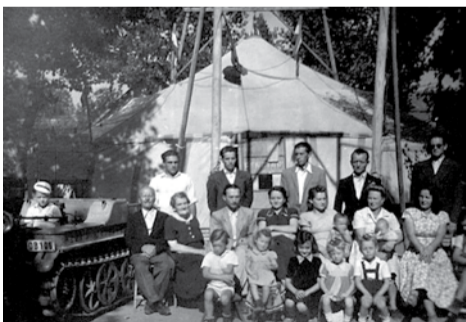
Ötvös cirkusz, balra a hernyótalpas, 1947

Édesanyám nagyon agilis volt, kellő határozottsággal intézett mindent. Kis, spórolt pénzükből darabokban vették meg a cirkuszi sátor ponyváját, amit lassacskán összevarrtak, így meglelt a saját sátruk és önállóulhadtak. Így jött el 1949, akkor államosították a cirkuszukat. Lajosmizsén állt éppen a sátor, amikor megjelent egy