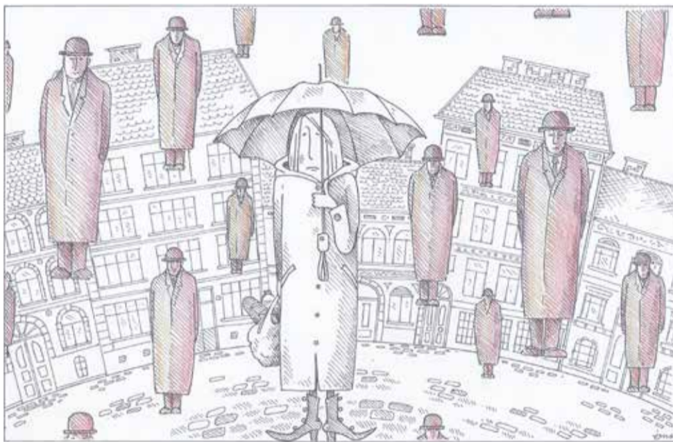
Megint esik Szűcs Édua rajza

Most itt a tárca szabályai szerint egy elegáns fordulattal vissza kéne kanyarodnom Erzsébetvárosba, de hogyan, ha ott nincs vasútállomás?