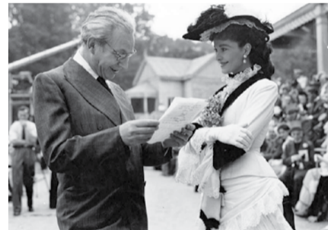
Korda Sándor Vivien Leigh színésznővel az Anna Karenina forgatásán

kifejtett munkásságáért. Többször tönkrement, de mindig újrakezdte. Élete utolsó kilenc évében negyvenegy film producere volt. 1955 novemberében Amerikában érte az első szívroham. Ezt követte a második, immár végzetes Londonban, 1956. január 22-én éjjel.