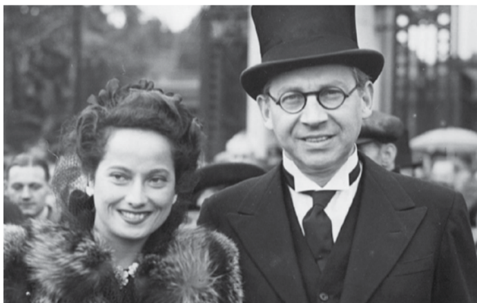
Lovaggá ütését követően távozik Sir Alexander Korda a Buckingham-palotából feleségével, a filmsztár Merle Oberonnal (1911-1979) kart karba öltve 1942-ben. Ő volt az első filmes, aki elnyerte a lovagi címet

Az Erzsébet körút lovagja mindig magyar állampolgár volt, az is maradt. Egyszer megkérdezték, miért nem veszi fel az angol állampolgárságot. Szokott humorával felelte: „Akkor hogyan utasíthatnám el azt a sok tehetségtelen angolt, aki nálam valamilyen munkáért jelentkezik, így idegenek.”