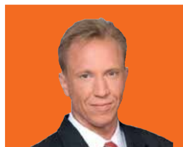
RIPKA ANDRÁS a 4. választókerület képviselője

Körzetemben, a 4. számú választókerületben folyamatosan adom át a pályázaton elnyert szén-monoxid-érzékelőket az erzsébetvárosiaknak. Még az előző fideszes városvezetés kezdeményezte ezt a nagyon fontos lakossági támogatást a kerületben, reméljük, a kerületi baloldal nem tervezi ezt is elvenni az erzsébetvárosiaktól. Biztatok mindenkit, hogy a következő pályázaton induljon, hiszen ez a készülék életet ment. A pályázat kiírásáról hírlevélben, illetve hirdetőtáblán tájékoztatni fogom körzetem lakóit.