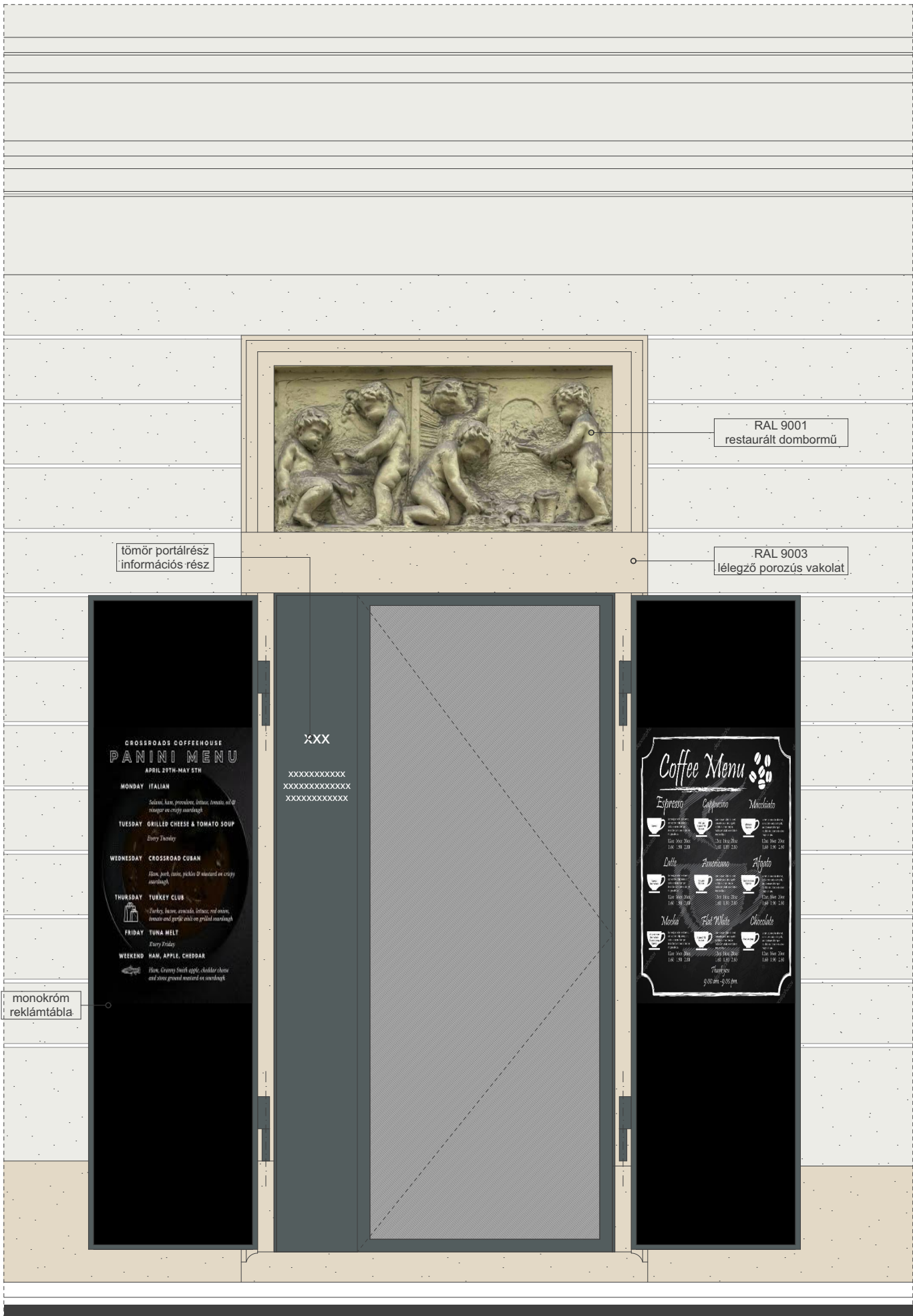
Portál részletnézete (nyitott zsalú)