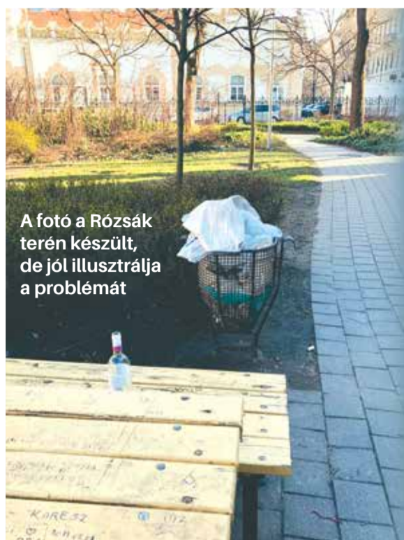
A fotó a Rózsák terén készült, de jól illusztrálja a problémát